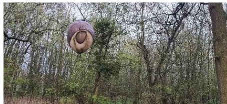
Naar het wezen van de bij, kan kunst de bij redden? van Jef Wijnants