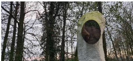
De Wachter van Claude Dendauw

In het eerste stukje van de tocht volgen we een deel van de kunstroute biZAR. Op de website van wandelen in de Vlaamse Ardennen lees ik hierover: "Geïnspireerd door het landschap plaatsen kunstenaars gedurende vier maanden tijdelijk werk. Natuur en kunst versterken elkaar en zorgen voor een originele wandelbeleving." We zien onder andere: